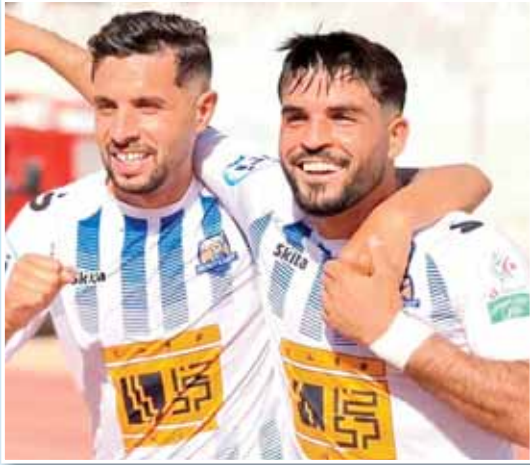
ضغطا شديدا خلال مجريات البطولة وأقضي أياما بجانب عائلتي الكريمة.»