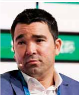
رحيل مضيد اقتصادياً.. ومؤلم رياضياً

تتابع عدداً من أبرز المهاجمين في العالم، لكن المشكلة أن معظم هؤلاء الجرم اغمر متاحين للبيع أو أن أتديهم ترفض تماماً فكرة التفويض بشأنهم. وكانت أسماء مثل هاري كين وإبراهيم هلاله ولاوتارو مارتينيز حاضرة في أجندة برشلونة خلال فترات انتقال سابقة، إلا أن الواقع الاقتصادي والظروف التعاقدية جعلت التعاقد مع أي منهم أمراً شبه مستحيل. وفي حالة هاري كين تحديداً، جاء الرد بشكل واضح من أولي هونيس، الرئيس الفخري لبايرن ميونخ، الذي أكد أن برشلونة لا يملك الإمكانيات المالية اللازمة لإتمام صفقة بهذا الحجم.