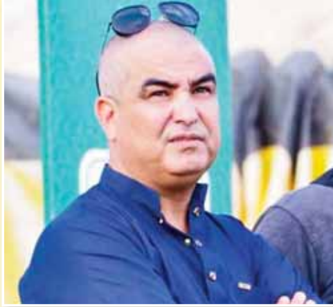
المالية الخائفة التي يعيشها النادي هذه الصائفة.