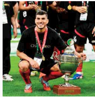
بفضل مستوياته اللابئة كما ساهم في تنويع فرقه بلقنين و هو ما جعل الإدارة تعتبره من أفضل الخيارات المتاحة