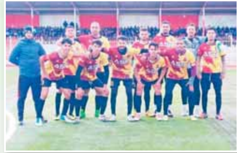
بلقب البطولة الولائية لموسم 2025-2026 عن جدارة واستحقاق،