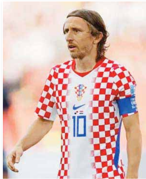
اعترف لوكا مودريتش، نجم ميلان، بأن نهاية مسيرته الكروية قد باتت قريبة، مشيداً في الوقت ذاته بالأداء الخيالي الذي قدمه مواطنه ونجم إتر ميلان بيار سوسيتش ضد غانا في كأس العالم 2026. وأدّل نجم ميلان مودريتش بمقابلة لصحيفة "لاغازيتا ديلو سبورت" الإيطالية، يوم الإثنين، ناقش فيها أيضاً خططه المتعلقة بالمستقبل. ويتنهي

عقد مودريتش مع ميلان رسمياً بنهاية الشهر الجاري، حيث أفادت التقارير بأن الروسي متفحون على تفعيل بند لتمديد العقد حتى عام 2027، لكنهم ينتظرون قرار النجم الكرواتي. وسيلعب مودريتش من العمر 41 عاماً في شهر سبتمبر المقبل، وستكون هذه النسخة بالتأكيد هي آخر بطولة كأس عالم يشارك فيها. وقال مودريتش: "أستمتع بكل لحظة، وبكل حصة تدريبية، وبكل مباراة". وأضاف النجم الكرواتي: "أعلم أنني في سن معينة وأن نهاية مسيرتي الكروية باتت قريبة. أحاول الاستمتاع بما قدر الإمكان، لكن الأمر ليس سهلاً خاصة في ظل الضغوط الهائلة الواقعة على المنتخب". ويعد مودريتش قائد وزعيم منتخب كرواتيا المنيء بنجوم الدوري الإيطالي، من فيهم لاعب وسط إتر ميلان سوسيتش. وكان اللاعب البالغ من العمر 22 عاماً، والذي أكمل لتو موسمه الأول مع إتر ميلان، قد سجل الهدف الافتتاحي في المباراة التي انتهت بالفوز بنتيجة 2-1 على غانا يوم السبت الماضي، ما سمح لكرواتيا بإنهاء دور المجموعات في وصافة المجموعة الـ 12، بفارق نقطة واحدة خلف إنجلترا. وصرح مودريتش: "لقد قدم سوسيتش أداءً خيالياً ضد غانا، وأثبت أنه يمثل الحاضر وليس فقط مستقبل المنتخب". وتابع قائد كرواتيا حديثه بالقول: "الفضل يعود إليه فيما يقدمه منذ انضمامه إلى الفريق، وأتني أن يستمر على هذا النحو". واستتم مودريتش تصريحاته بالنظر إلى الفترات المثيرة للجدل المخصصة لشرب البيرة في كأس العالم، قائلاً: "هذا أمر يتعين علينا دراسته، لكنني لا أشعر بالرغبة في القول بأنه يشكل مشكلة".