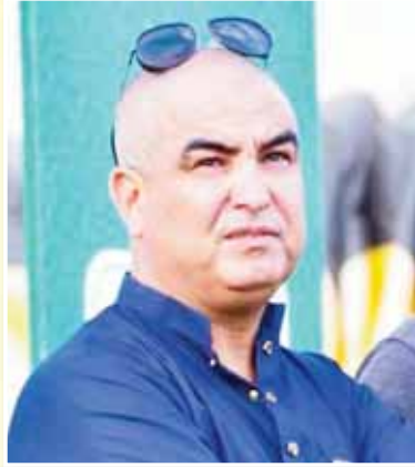
موجود في الوقت الحالي.