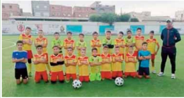
غليزان سنة 2024 و فاز بدورة رمضان بدائرة

و بعد سنوات من العمل في مجال التكوين، يطمح مسؤولو اتحاد برمادية إلى الانتقال إلى مرحلة جديدة تتمثل في الانخراط ضمن رابطة غليزان لكرة القدم، و هو مشروع يعتبرونه محطة أساسية في مسيرة النادي لأنه سيفتح المجال أمام مختلف الفئات العمرية للمشاركة في المنافسات الرسمية و يمنح اللاعبين فرصة أكبر للإبراز إمكانياتهم إلى جانب تعزيز مكانة المدرسة كأحد أهم مراكز التكوين الكروي بالمنطقة كما يسعى القائمون على النادي إلى توسيع قاعدة الممارسين واستقطاب أكبر عدد ممكن من الأطفال خاصة و أن حي برمادية يعد من أكبر الأحياء السكنية بمدينة غليزان ما يجعل المدرسة مؤهلة لأن تكون مشتتاً حقيقياً للموهب خلال السنوات المقبلة.