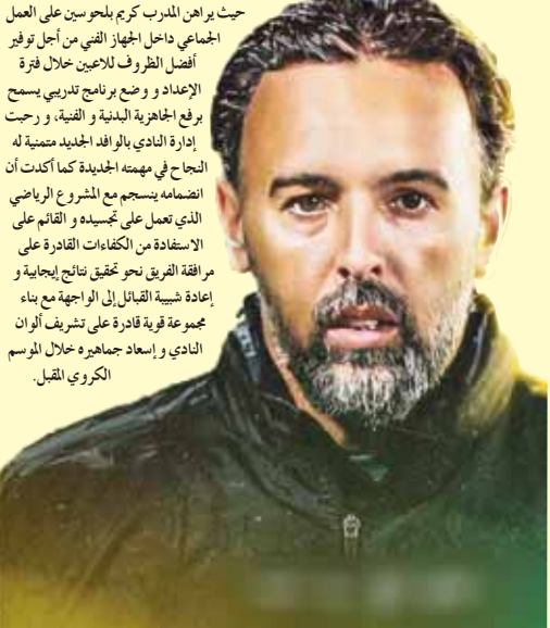
أفضل الظروف للاعبين خلال فترة الإعداد ووضع برنامج تدريبي يسمح برفع الجاهزية البدنية والفنية، ورحبت إدارة النادي بالوفاء الجديد متمنية له النجاح في مهمته الجديدة كما أكدت أن انضمامه يساهم مع المشروع الرياضي الذي تعمل على تجسيده والقائم على الاستفادة من الكفاءات القادرة على مرافقة الفريق نحو تحقيق نتائج إيجابية وإعادة شبيبة القبائل إلى الواجهة مع بناء مجموعة قوية قادرة على تشريف ألوان النادي وإسعاد جماهيره خلال الموسم الكروي المقبل.