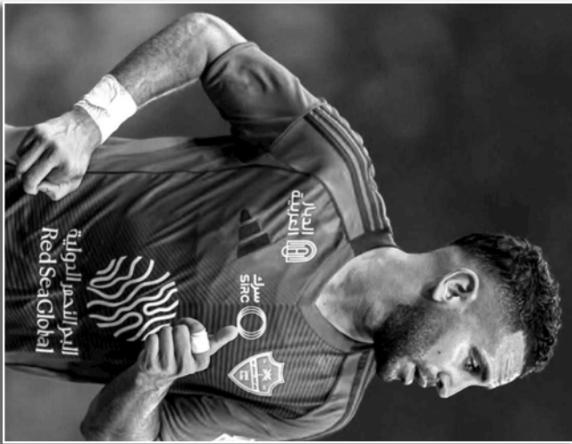
Malgré ce palmarès éloquent, sa valeur marchande est retombée à 5 millions lors de son transfert.

Le joueur avait le début de la nouvelle saison. Malgré une période compliquée, l'ancien joueur d'Empoli conserve une solide réputation grâce à ses performances passées en Serie A et sur la scène européenne. La saison dernière, le Fenerbahçe avait été prêt à payer 20 millions pour la recruter. Cette situation a également permis à l'ancien joueur de l'Atletico de Madrid de retrouver le niveau qui avait fait de lui l'un des meilleurs milieux européens.