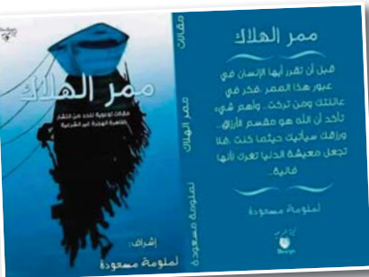
كتاب «ممر الهلاك» للكاتبة الموهبة صاعدة أسامة شعيب، وهو من إصدارات دار النشر «الكتاب» في الجزائر.

«شكرا على الإستضافة الطيبة وفقنا الله أجمعين فيما يحبه ويرضاه، اللهم ارفع عنا هذا البلاء والوباء واغني مرضانا واهدنا واصلح أحوالنا.»