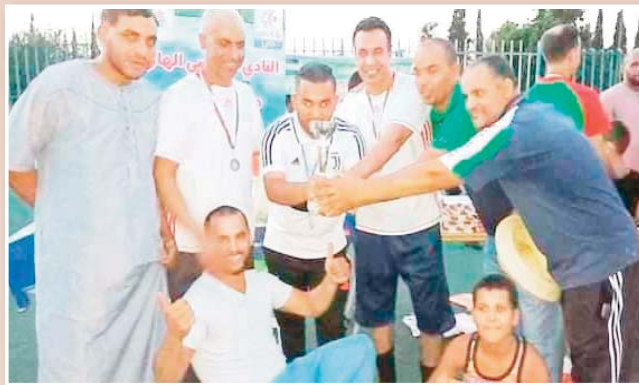
لواحد ليتوجوا بالدورة في طبيعتها الأولى.

وبالعودة للحديث عن دورة الكهول التي جمعت معظم اللاعبين السابقين في ولاية غليزان، فقد استمتع