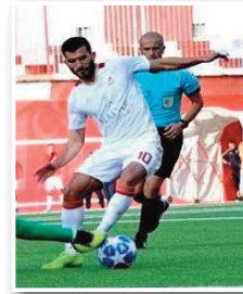
الكناري في طريق مفتوح أمام أهلي البرج الجريج

بيت المكرة الذي يواجه دون إدارة ولا طاقم فني بعد الاستقالة الجماعية وهو ما يهدد تفلق الفريق إلى العاصمة.