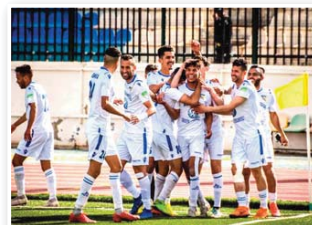
من قول كلمته عند نهاية الموسم.