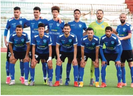
الإصابات تصعب من مأمورية الوداد