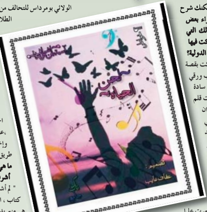
حقيقية مرت عليا في سنة 2020 هي مشاركات جد متواضعة لم أكلف نفسي فيها كثيرا تكلفت كلها بنجاح لأنها كانت نابعة من القلب". مى بدأت قصتك مع الخواطر؟ " في بداياتي كنت أعشق الشعر وأقرأ كثيرا الشعر للشعراء الجاهليين".

ما هو دور الشعر والأدب في عصر الكمبيوتر وعصر الاسهلاك؟ " منافسة شرسة بين الشعر والأدب في عصر التكنولوجيا، أعقد أن الكمبيوتر والاسهلاك طغى والسبب الأول والأخير هو كتاب وشعراء هذا العصر". ما هي مشاريعك القادمة؟ " المشروع الأول إكمال ماسم تخرجي 2021 بعدا تأتي مشاريع الأخرى".