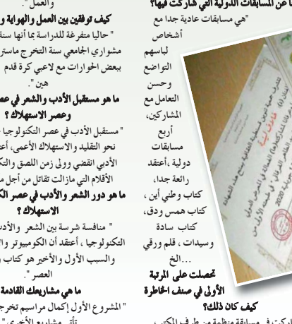
هل لك على أكتيك؟ " شاركت في مسابقة منظمة من طرف المكتب

ما هي هوايتك المفضلة من غير الكتابة؟ " هوايتي المفضلة مشاهدة مباريات كرة القدم وتقليد حفيظ دراجي وهو يصدر في التعليق، التصوير الفتوغرافي كذلك". ما هو إحساسك وأنت تكلمين رواية؟ " لم أكتب رواية، لم أقرأ الروايات وأعتبرها أسوء الأصناف الأدبية". هل يمكن أن تكلمي قصة حياتك؟ " قصة حياتي مؤلمة كثيرة، أعقد أن لو أكتيبا سأحج فيها". لو أردت تقديم نصيحة للشباب والبنات ماذا تقولين؟ " نصيحة أخوية لكل من له حلم أن يقاتل لأخر رمق ولا يتخلى الإبداع لا يموت، لكنه يحتاج إلى تحفيز للتجديد، لذلك حفر نفسك ولا تنتظر من أحد إمداد يد العون".