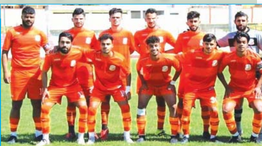
الفريق يدخل المنطقة الحمراء

يقدم النجم الدولي الجزائري السابق، نذير بلحاج، دروسا مجانية لكل اللاعبين خاصة الجزائريين منهم، حيث لا يزال الظهير الأيسر السريع يتمتع بلياقته البدنية المعهودة 'ما شاء الله عليه'، حيث يقارب الأربعين من العمر ولا تزال الانطلاقات السريعة، والعرضيات السحرية، و الأهداف الرائعة تنبعث من قدمي بلحاج، الذي ضمّ لقباً جديداً لجزائريته مؤخرا مع نادي السيلية القطرية، بالإضافة إلى أنه قائد حقيقي لتناديه ولاعب مهم للغاية في صفوف النادي، وإن دل هذا الأمر على شيء إنما يدل على الجدية الكبيرة التي يمتاز بها هذا اللاعب، و الاحترافية العالية التي تعد السمة البارزة في مشواره الرياضي، و لولا هاتين الصفتين لكان قد اعتزل قبل خمس أعوام قبل الآن على الأقل. نذير كان أحد أبرز اللاعبين الذين تعلقنا بهم خلال مشوار المنتخب الوطني في تصفيات مونديال جنوب إفريقيا 2010، و قبل المباراة الأسطورية في أم درمان السودانية ضد الكتيبة المصرية، كنا نسعد كثيرا بمشاهدته يقيميص نادي ليون وهو يلعب دوري الأبطال ضد البرصا، و في البريمير ليغ وهو ينافس أكبر النجوم العالمية، خاصة في المباريات ضد المان يونايتد كان الصراع كبيرا في الراق السريع بينه وبين القتي آنذاك كريستيانو رونالدو، و جل أقرانه قد اعتزلوا و توجهوا لمنهن أخرى ولا يزال نذير متعلق بمحبوبته و يريفض ورائها في الميادين، "ما شاء الله عليه".