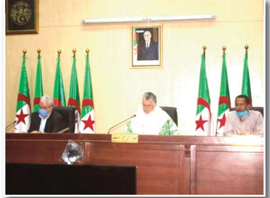
تطرق مدير الصحة والسكان لمنراست إلى مجموع الحالات المسجلة والمؤكد على مستوى الولاية، وصرح أن الوضعية مستقرة مقارنة

السياق أعطى السيد الوالي تعليمات صارمة ترتبط بإعادة تفعيل البروتوكول الصحي و تشديد تطبيق الإجراءات الوقائية، إجبارية وضع الكمادة على مستوى جميع المديرات والمؤسسات، تبنى حملات التوعية والتحميس بخطورة الوضع وتفاقمه إذا لم نلتزم بالبروتوكول الصحي بالاعتماد على الإذاعة الجهوية، صفحة الولاية واستغلال الوضعات الإشهارية للتوعية، تعزيز المراقبة المشددة للبروتوكول الصحي عبر الحدود وعدم التردد في روع التجار أو سائقي الحافلات المخالفين للإجراءات الصحية الوقائية المعمول به، كثيف الخرجات الميدانية من طرف لجنة تنسيقية تضم مدير الصحة، مدير التجارة، مدير الحماية المدنية، رئيس الدائرة والمصالح الأمنية لمراقبة مدى تطبيق الإجراءات الوقائية تفاديا لجائحة ثالثة، مراقبة دخول وخروج المسافرين برا وجوا لاسيما في الأيام المقبلة ونحن على أبواب عيد الفطر المبارك وما يتخلله من تجمعات عائلية، أكد والي الولاية أيضا على البدء في تجسيد وتفعيل برنامج تعقيم الشوارع