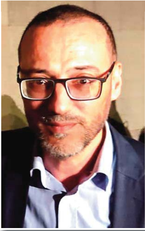
"صوت الشعب هو سيد القرار"

كما واصل أنه نتيجة لثقافته بدرجة الوعي الذي وصل إليه شعبنا وشبابنا قرر أن يخوض غمار الانتخابات التشريعية ليكون صوت الشعب الذي هو سيد القرار، فما هو إلا فرد منه ويريد أن يكون مرآة عاكسة لمطالبه في العدالة الاجتماعية التي سيحرص أن تجسد بقوانين تقضي على كل ما يحول بين المواطن وحقه، في العيش الكريم في ديمقراطية، وبعيدا عن كل أشكال البيروقراطية والطبقة، وإحداث القطيعة مع كل الممارسات التي تمس المصلحة العامة للبلاد والعباد وتعيق التنمية الاقتصادية.