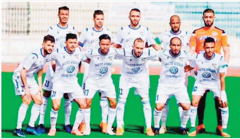
خطف لاعي الشبيبة، في وقت يتواصل فيه الغموض داخل بيت الزرقاء.