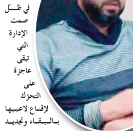
الأجزاء في ظل صمت الإدارة التي تبقى عاجزة على التحرك لإقناع لاعبيها بالبقاء وتجديد

ويبقى الأكد أن إدارة الشبيبة مطالبة بالتحرك في جميع الاتجاهات وبسرعة كبيرة لإيجاد حل سريع لعقد الجمعية العامة الانتخابية، بانتخاب رئيس جديد يقود الفريق وهذا بضرورة إقناع اللاعبين بالبقاء