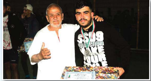
شهد الملعب الجوارى يحي الزيتون تنظيم دورة كروية في طبعتها الثانية، من تنظيم النادي الهاوي الزيتون ، بحيث انطلقت الدورة في اليوم الأول من شهر رمضان وتواصلت خلال شهر رمضان حتى يوم 29 ، هذا وقد شارك فيها 40 فريق في الأكاير و 16 فريق من الكهول يمثلون أحياء بلديات ودوائر ولاية وهران . وعرفت الدورة استقطاب الكثير من الشباب