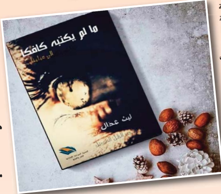
ما هو دور الشعر والأدب في عصر الكمبيوتر وعصر الاستهلاك؟

"شكرا جزيل لك على هاته المبادرة الشيقة، و نلتقي مع أعمال أخرى."