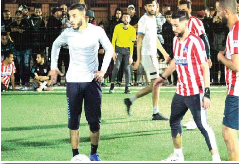
الرياضة الجوارية . الدورة مرت في ظروف جيدة طوال 29 يوما ، حيث كانت رغبة الجميع ان تكون هناك دورات أخرى في السنوات القادمة.