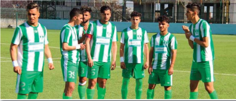
زرقيين و مباركي عادا بشكل طبيعي

وأكدوا مرارا وتكرارا بأنهم لم يقدموا أي هدايا للمنافسين.