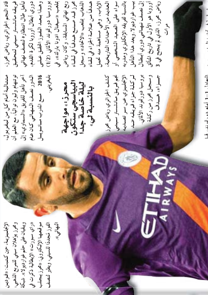
اللاعب المحرز في نصف نهائي دوري الأبطال لأول مرة

في المباراة التي أقيمت في استاد الأمير عبد القادر، تمكن اللاعب الجزائري من تسجيل هدفه الأول في دوري الأبطال، وذلك في الدقيقة 17 من عمر المباراة. هذا الهدف جاء في الدقيقة الأخيرة من المباراة، مما أضاف إلى رصيد فريقه في البطولة. اللاعب شارك في المباراة بأكملها، وظهرت مهارته في اللعب وسط الميدان، حيث تمكن من تمرير الكرة بدقة إلى زملائه في الفريق.