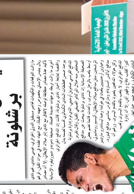
اللاعب الجزائري يحتفل بعد تسجيله لهدفه

في المباراة التي أقيمت في استاد الأمير عبد القادر، تمكن اللاعب الجزائري من تسجيل هدفه الأول في دوري الأبطال، وذلك في الدقيقة 17 من عمر المباراة. هذا الهدف جاء في الدقيقة الأخيرة من المباراة، مما أضاف إلى رصيد فريقه في البطولة. اللاعب شارك في المباراة بأكملها، وظهرت مهارته في اللعب وسط الميدان، حيث تمكن من تمرير الكرة بدقة إلى زملائه في الفريق.