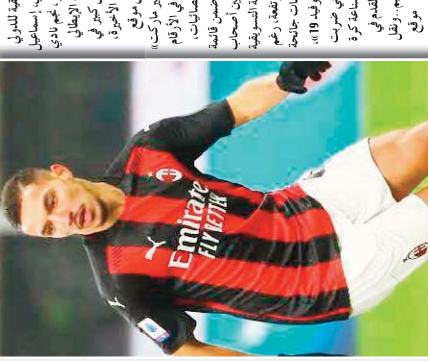
اللاعب الجزائري يحتفل بعد تسجيله لهدفه

في المباراة التي أقيمت في استاد الأمير عبد القادر، تمكن اللاعب الجزائري من تسجيل هدفه الأول في دوري الأبطال، وذلك في الدقيقة 17 من عمر المباراة. هذا الهدف جاء في الدقيقة الأخيرة من المباراة، مما أضاف إلى رصيد فريقه في البطولة. اللاعب شارك في المباراة بأكملها، وظهرت مهارته في اللعب وسط الميدان، حيث تمكن من تمرير الكرة بدقة إلى زملائه في الفريق.