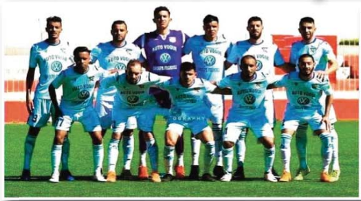
خطة من المباراة ويسعى للإطاحة بالفريق الآخر.

القسم، إلا أن أشبال المدرب عصمان قادرين على الإطاحة بمنافسها بالنظر إلى الحرارة الشديدة التي يلعب بها أبناء "سدي خال" في مثل هذه المواعيد الهامة، كما أن حمية الفوز تقرض عليهم بذل جهود إضافية للوصول إلى هذا الهدف.