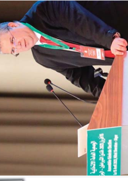
الرئيس الجديد للفاف يتحدث في مؤتمر صحفي

تمت اختيار الرئيس الجديد للفاف، وهو من ذوي الخبرة والتميز في المجال الرياضي. الرئيس الجديد سيلتزم بالقيم والروح التي تمثلها الفاف، وسيعمل على تطوير القطاع الرياضي في الجزائر. الرئيس الجديد أكد على أهمية العمل بروح الفريق الواحد، والتعاون مع كافة الأطراف المعنية في القطاع الرياضي.