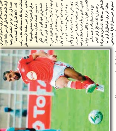
بوخشوش يسحب شكواه... بوخشوش يسحب شكواه... بوخشوش يسحب شكواه...