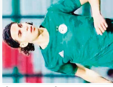
سكون العسكر القابل للتمسك بالكرة في ظهوره في مباراة...