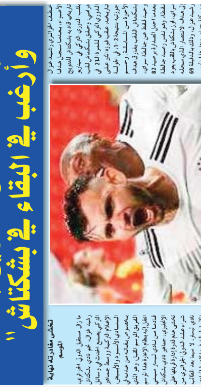
تتشى مغارة له نهاية الموسم