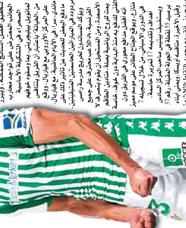
جماهير بيير غضب... جماهير بيير غضب... جماهير بيير غضب...