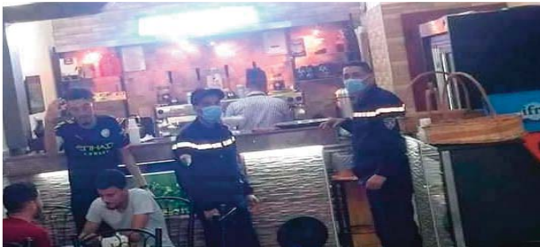
في إطار برنامج النشاط المسطر والمتعلق بالوقاية من فيروس كورونا مواصلة حملات التوعية والتحميس، قامت مديرية الحماية المدنية لولاية وهران بمهمة