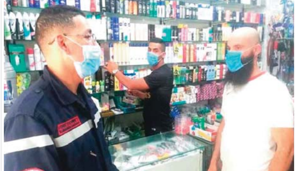
المواطنين بضرورة التقيد بالنصائح والإرشادات الوقائية المتعلقة بغير فيروس كورونا كوفيد 19. العملية لاقت تفاعلا كبيرا من طرف التجار والمواطنين الذين تشكروا أعوان الحماية المدنية على مجهودات الجبارة التي يبذلونها من أجل حماية صحة المواطن.

سجلت 174 إصابة جديدة بغير فيروس كورونا (كوفيد-19) و7 وفيات خلال الـ 24 ساعة الأخيرة في الجزائر، فيما تماثل 117 مريضا للشفاء، حسب ما كشفت عنه الإذاعة ووزارة الصحة والسكان وإصلاح المستشفيات في بيان لها. وبلغ العدد الإجمالي للحالات المؤكدة 125.485 حالة، من بينها 174 إصابة جديدة، بينما بلغ العدد الإجمالي للمصابين الذين تماثلوا للشفاء 87.476 شخص والعدد الإجمالي للوفيات 3.381 حالة. كما يتواجد حاليا 22 مريضا في العناية المركزة، حسب المصدر ذاته. وأفاد البيان بأنه تم تسجيل بها أي حالة و14 ولاية أخرى سجلت ما بين حالة 1 إلى تسع 9 حالات، فيما سجلت 4 ولايات أخرى مزيد من 10 حالات. وفي هذا الإطار، توصي الوزارة المواطنين بضرورة الالتزام بالبقطة، مع احترام قواعد النظافة والمسافة الجسدية والارتداء الإلزامي للقناع الواقعي والامتثال لقواعد الحجر الصحي. كما تؤكد على أن الالتزام الصارم من قبل المواطنين بهذه الإجراءات الوقائية، إلى جانب أخذ الحيطة والحذر، هي عوامل مهمة إلى غاية القضاء نهائيا على هذا الوباء.