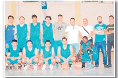
في سياق البطولة الجامعية الجهوية لكرة السلة فازت جامعة معسكر على جامعة تيارت، في مباراة متكافئة في بدايتها إلا أن

معسكر أن وسع الفارق إلى حوالي عشرين نقطة مع الهيار كبير للفريق الخصم، والذي سمح لطلاب جامعة معسكر