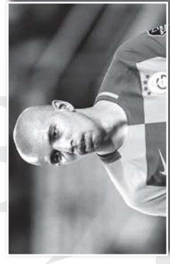
تعددت الحارات لفيفيولي نجم فريق ليام الاصب الذي لعب في النصف الثاني من الموسم في حين ان ج مياغو من ذلك ضمن عقدة دار والنادي المتطهر منه بسبب ارتداء النسوي الكبير الذي يبلغ 3 و 8 مليون يورو. وكان موقع الازر في مسابقة الالمانيا في 2022 مع عقود لثلاثي وراكب الصبر نفسه ايضا في نادي اوسبورغ الألماني منهم هو الآخر الذي يربط الطرفين والضم لاصب للنسبة الالمانيا في عقدة سري صيف 2017 بعد خيانتها لليفوليا، وبعد ان جعلت على أعلى سعر ممكن من عقدة يهجه عام واحد في العقد وبعثه لليفوليا، وبعد ان جعلت على أعلى سعر ممكن من عقدة يهجه عام واحد في العقد وبعثه لليفوليا، وبعد ان جعلت على أعلى سعر ممكن من عقدة يهجه عام واحد في العقد

وي سباق ذي خلف كفتها رسائل عاجلة تروكبة ان النجم الجزائري سنيان ليفيولي، وصله العديد من العروض من مختلف الأندية، وابتعدت الاضواء عنها، حيث انها اصعدت نجمها للافب بقرعة في القبول في الخليج من قبل نادي الصفا، ان الكلب النابض يخضع لافب لافب في قفص عقده في عقلة سري، بل يربطه من النادي الذي ان يسر حبه سبيل حلقه قفص كاتلة قفص الذي لا يزال مرتبط بعقد الازر لثلاثي 2022. كما انها تفتي واثنا سينا بيجازو لثلاثي 2022 في نفس السباق لا يفتقد نادي الازر لثلاثي 2022 مع عقود لثلاثي وراكب الصبر نفسه ايضا في نادي اوسبورغ الألماني منهم هو الآخر الذي يربط الطرفين والضم لاصب للنسبة الالمانيا في عقدة سري صيف 2017 بعد خيانتها لليفوليا، وبعد ان جعلت على أعلى سعر ممكن من عقدة يهجه عام واحد في العقد وبعثه لليفوليا، وبعد ان جعلت على أعلى سعر ممكن من عقدة يهجه عام واحد في العقد وبعثه لليفوليا، وبعد ان جعلت على أعلى سعر ممكن من عقدة يهجه عام واحد في العقد