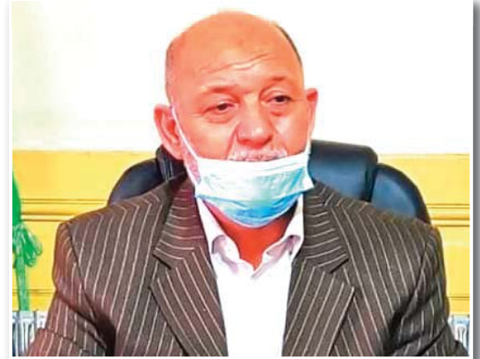
تسجل ولاية سيدي بلعباس استقرارا في حالات الإصابة بوباء كورونا، بالنظر إلى انخفاض معدل الحالات الاستشفائية على مستوى المؤسسة العمومية للصحة الجوارية "دحماني سليمان"