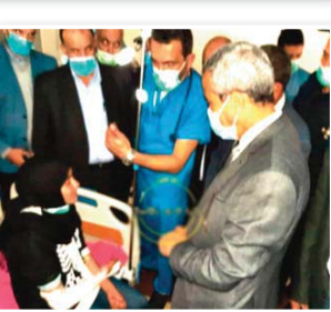
الحالة الصحية للمصابين وتكفل الأطقم الطبية بتقديم كافة الإسعافات لهم، واستمع لإشغالاتهم المرتبطة بالنقل المدرسي.

لقوله تلقيه النبأ، تنقل حروف بن عرعار والي ولاية الطارف، بحضور رئيس المجلس الشعبي الولائي، على نحو من السرعة، إلى مصلحة الاستعجالات الطبية بالمؤسسة العمومية الاستشفائية ببوحجار، للإطمنان على الوضعية الصحية لـ 18 تلميذا مصابا إثر تعرض الحافلة المدرسية التي كانت تقلهم من متوسطة واد الزيتون إلى مشاتي ذات البلدية لحادث مرور، حيث وقف السيد الوالي سير عملية تقديم الإسعافات والتكفل لطبي بالمصابين، كما أكد على ضرورة التكفل النفسي بهم. كما كان له لقاء مع أسر التلاميذ المصابين، أين طمأنهم على