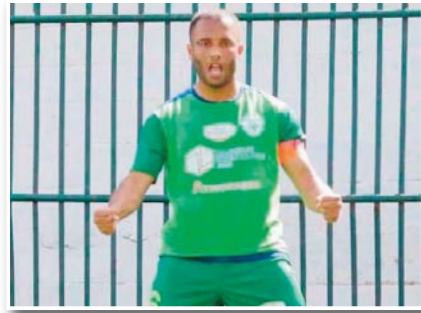
صغيرا في السن».