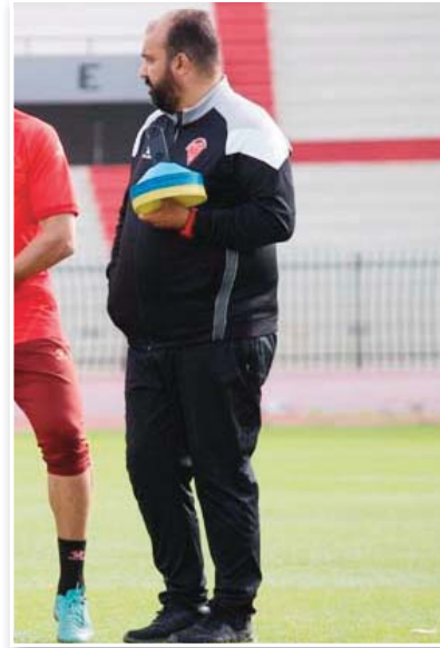
بعدما كان خارج حسابات المدرب مضوي في مواجهة أهلي

هذا وتحدث مدرب مولودية وهران مضوي عن مواجهة سريع غليزان والزامية التحضير لها بإعداد مكتمل عندما قال: «نولي أهمية كبيرة لمواجهة الدور المقبل من كأس الرابطة أمام سريع غليزان كونها تعبر محطة جديدة نحو الذهاب بعيدا في هذه المنافسة، ونأمل في جاهزية كل التعداد مع عودة المصابين لضمان أفضل تحضير لسهة المواجهة الخالية».