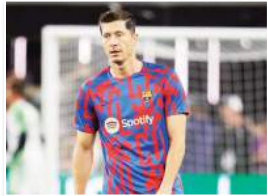
رد البولندي روبرت ليفاندوفسكي، مهاجم برشلونة، على العرض السعودي الذي حصل عليه مؤخراً، بهدف الحصول على خدماته خلال فترة الانتقالات الصيفية المقبلة. وذكرت تقارير

إسبانية أن أحد أندية السعودية عرضت على ليفا منذ عدة أسابيع، الحصول على راتب يتجاوز الـ 100 مليون يورو، نظير اللعب في دوري روشن. ووفقاً لصحيفة "سبورت" الإسبانية، فقد رفض ليفا العرض السعودي الذي يضاعف راتبه 3 مرات، مقررًا البقاء مع برشلونة في الموسم المقبل. وأشارت الصحيفة إلى أن ليفاندوفسكي لن يغير قراره بشأن الرحيل إلا في حالة حدوث مفاجأة كبيرة في علاقته بالبارسا. وأوضح أن المهاجم البولندي أبلغ قراره بالفعل إلى وكيله بيني زهافي. وذكرت أن رحيل ليفا في الصيف قد يتسبب في كارثة حقيقية لبرشلونة بالموسم المقبل، لأن سعر بيعه قد يبلغ 40 مليون يورو فقط، وهو رقم لن يساعد البارسا على التعاقد مع أحد المهاجم الكبار. ويفضل برشلونة تأجيل رحيل ليفا إلى صيف 2025، حيث يفضل الرئيس خوان لابورتا التعاقد مع إيرلينج هالاند، مهاجم مانشستر سيتي، في هذا التوقيت.