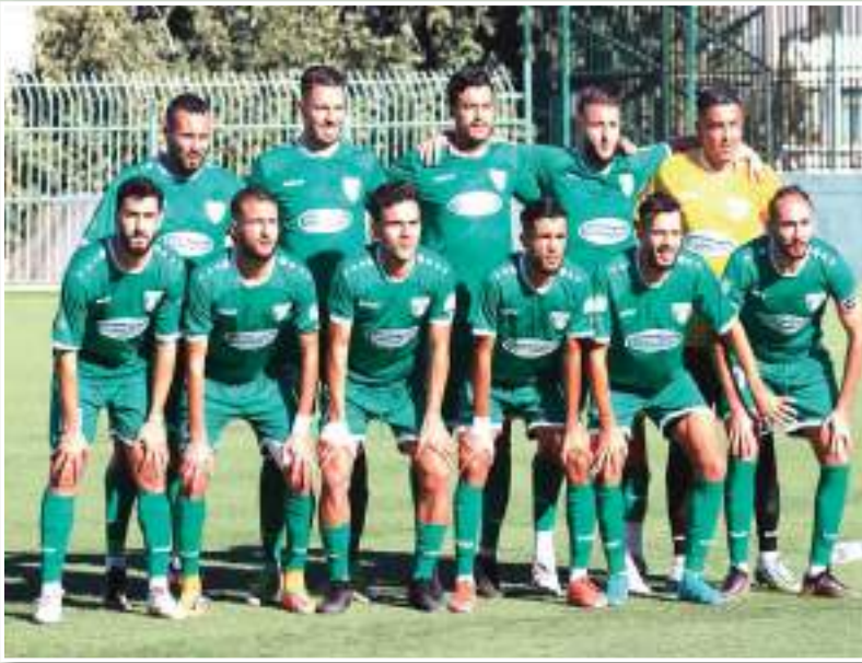
أهداف لهدفين، وبذلك فإن الأمل بات على بعد نقطة واحدة لا غير من جمعية وهران التي تجمد رصيدها عند حدود النقطة الـ24، وهو ما يشير بأن خطرا