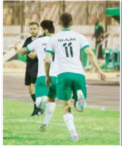
كان الموعد سهرا السيت مع استكمال مباريات ثمن نهائي منافسة كأس الجمهورية التي تمكّن خلالها متصدر ترتيب الرابطة