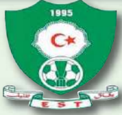
التشكيلة الخميلة لكل فريق: