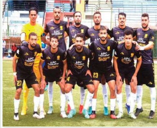
العناصر في مثل هذه اللقاءات.

حظوظهم، مما يتطلب على زملاء الحارس خلادي بذل مجهودات أكثر والتنافس بالروح المعادة مع وضع الثقة في قدراتهم إلى آخر لحظة من المباراة، بالإضافة إلى الاستثمار في عقدة المنافس بعدما سجل بعض التعثرات بميدانه خاصة وأداء لوطوننت خارج القواعد يبقى مميزا، بالإضافة إلى خبرة المدرب قداوي وجل