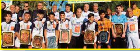
احتفلت بعيد ميلاد الأسطورة لخضر بلومي اختتام دورة "شياء فوت" تحت شعار: