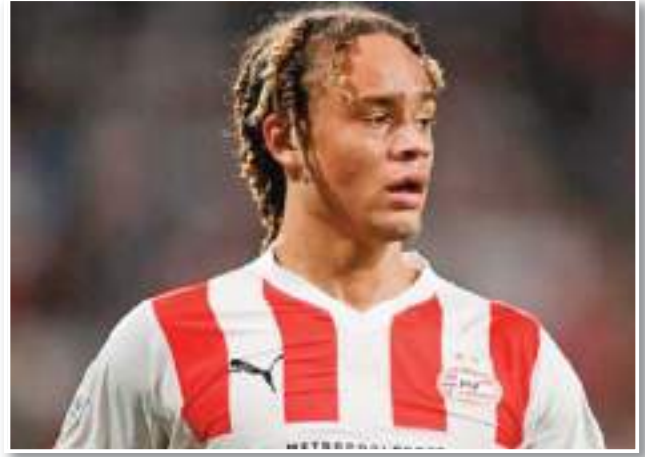
باريس سان جيرمان يرفض التشريط في تشافي سيمونز

فعلت بند إعادة شراء تشافي سيمونز من إيندهوفن الهولندي بقيمة 6 مليون يورو الصيف الماضي. وقام النادي الباريسي بإعارته لنادي لايزيغ من أجل كسب المزيد من الخبرة في ألمانيا. وبحسب تقرير نشرته صحيفة سبورت الكاتالونية فإن إدارة النادي الألماني أبدت رغبتها في الإبقاء على تشافي سيمونز لمدة موسم إضافي على سبيل الإعارة. وأشار التقرير إلى أن ناصر الخليفي رئيس نادي باريس سان جيرمان رفض مقترح النادي الألماني في هذا الملف. ولفتت الصحيفة الكاتالونية إلى أن استراتيجية النادي الباريسي حالياً تعتمد على وجود تشافي سيمونز كجزء من تشكيلة الفريق بنهاية هذا الموسم. وترغب الإدارة الباريسية في تمديد التعاقد مع تشافي سيمونز لعام إضافي بمجرد عودته للقلعة الباريسية. ولعب تشافي سيمونز قميص فرق ناشئ باريس سان جيرمان، ولعب 11 مباراة مع الفريق الأول.