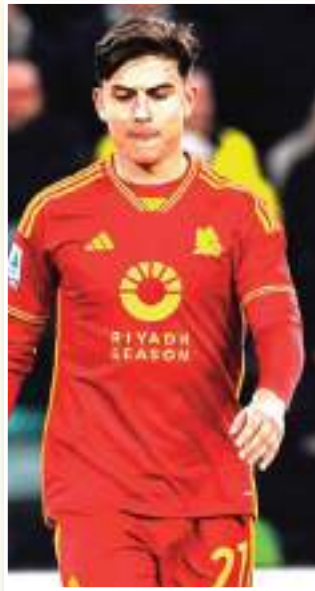
ذلك خلال سوق الانتقالات الشتوية.