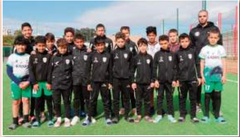
تغطية: نبيل شبيخي تصوير: يوسف . ش