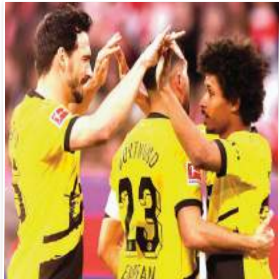
حقق فريق بوروسيا دورتموند فوزاً مُثبراً على غريمه التقليدي بايرن ميونخ بنتيجة 2-0، وذلك في كلاسيك الدوري الألماني.

وكان التهديد في المباراة التي استضافها ملعب أليانز ميونخ قد بدأ عن طريق كريم أدبي في الدقيقة 10. وجاء الهدف بعد انطلاقة سريعة من أدبي استغل فيها تمريرة بينة رائعة من زميله جوليان براندت قبل أن يُسكن الكرة الشباك بلمسة دقيقة. ونجح جوليان رايسون في تسجيل الهدف الثاني بعد تسديدة مُثقفة استغل بها هدفة من زميله الإيفاري سيباستيان هالر في الدقيقة 83. وقلص النجم الإنجليزي هاري كين الفارق بهدف للبايرين في الدقيقة 90 بعد لعبة رأسية مُثقفة ولكن الحكم ألغى الهدف بداعي التسلل بعد العودة لتقنية الفيديو «الفار». وارتفع رصيد دورتموند بعد الفوز في مباراة اليوم للنقطة رقم 53 يحتل بهم المركز الرابع في جدول ترتيب الدوري الألماني، فيما تجدد رصيد بايرن ميونخ عند النقطة رقم 60 في المركز الثاني. وأصبح الفارق بين بايرن ميونخ وليفركوزن المُتصدر 13 نقطة كاملة، حيث يحتل رجال المدرب تشابي ألونسو المركز الأول برصيد 73 نقطة. وسيلعب بايرن ميونخ الجولة المقبلة ضد هايدنهايم على أرض الأخير يوم السبت المقبل، فيما سيلعب دورتموند على أرضه ضد شوتغارت في نفس اليوم.