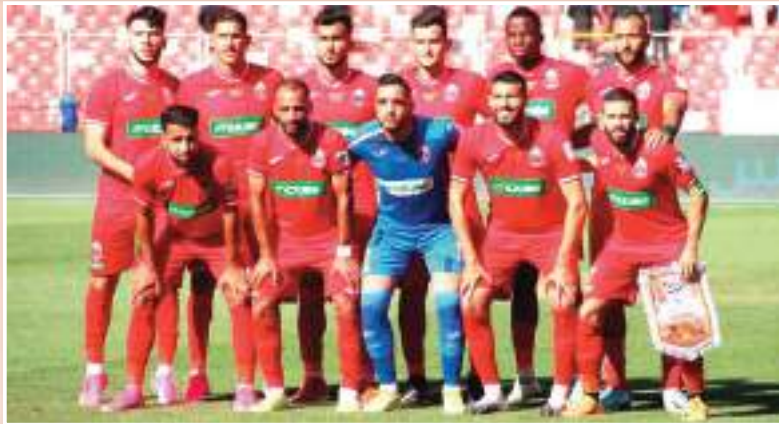
النادي ترأسه 21 سنة بعد رئاسته للرابطة.