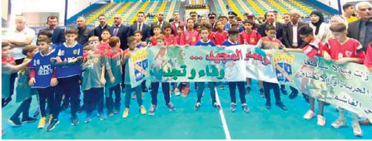
المهرجان، كما أكد رئيس الدائرة على ضرورة في القسم الوطني الأول، يبرز كأحد الأندية الرائدة في مجال