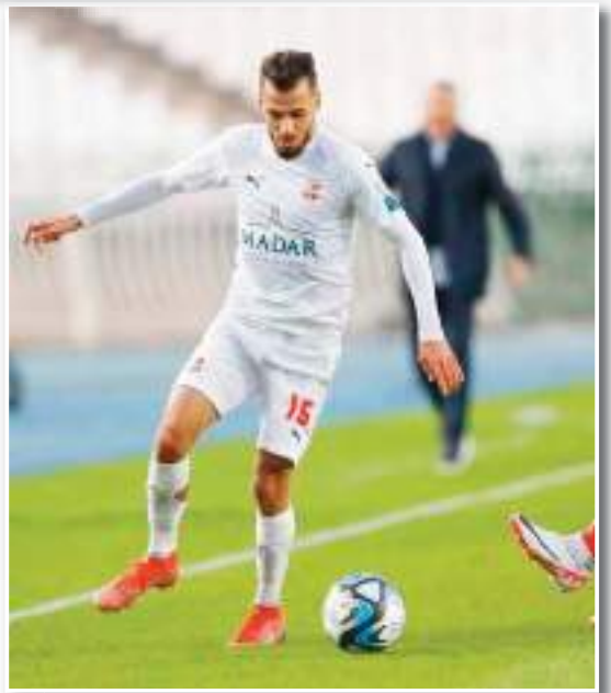
سيكون الموعد أمسية اليوم مع استكمال مباريات الرابطة المحترفة الأولى ، حيث الحسارة التي تلقاها في الجولة الماضية بشار و سيكون فريق جمعية الشلف أمام مهمة تدارك