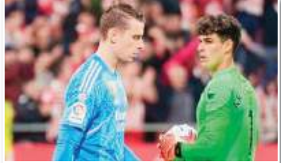
أنهى الإيطالي كارلو أنشيلوتي، مدرب ريال مدريد، الجدل حول هوية الحارس الأساسي للمرييني خلال الموسم الحالي. وتناوب كيبا أريزابالغا وأندري لونين على حراسة مرعى ريال

مدريد في الموسم الحالي، عقب إصابة البلجيكي تيبو كورتوا. ووفقاً لصحيفة "ماركا" الإسبانية، فإن الإصابة الخطيرة التي تعرض لها كيبا مؤخراً حسمت الجدل حول هوية الحارس الأساسي لريال مدريد أمام مايوركا. وأشارت الصحيفة الإسبانية إلى أن لونين هو من سيحرس مرعى ريال مدريد في المباراة المقبلة. وأوضحت أنه بعيداً عن إصابة كيبا، فإن التقييمات التي أجراها الجهاز الفني لريال مدريد بقيادة أنشيلوتي تشير إلى أن لونين هو من يجب أن يصبح الحارس الأساسي خلال الموسم الحالي. وذكرت أن رد فعل لونين كان أكثر من ممتاز عقب إصابة كيبا، كما أن الأخير لم تصدر عنه أي شكوى حول سلوكه وعمله وأدائه، لكن التحليل الداخلي داخل ريال مدريد يجعل نحو جعل الأوكراي الحارس الأساسي.