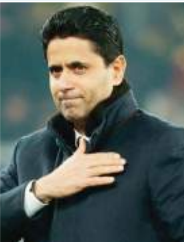
سيمونز مبلغ 4 ملايين يورو، وبعدها قام بإعارته لنادي لايفيزج الألماني.