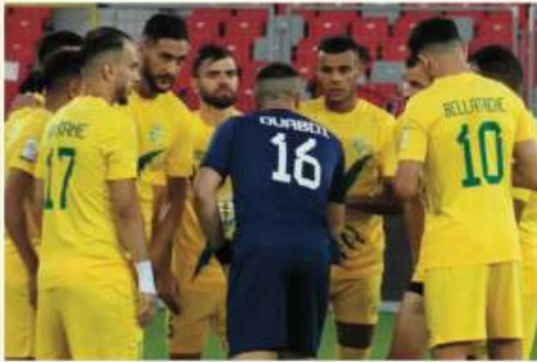
لبنانيا - مشوار فريق شبيبة الساورة الموسم الماضي في منافسة كأس الجمهورية كان جد الأول مرة في تاريخه بعد فوزه على نادي بارادو

على الرغم من أن منافسة كأس الجمهورية لا تعرف بالصغر والكبر وكثيرا ما حلت عدة مفاجآت، إلا أن الشيء الأكيد هو أن الفريق الذي يحلم بالتأهل بقب كأس الجمهورية أو الذهاب إلى أوار جد منظمة فيها، أن يوفقه على تحقيق أحلامه لا فريق شباب بوقطب ولا أي فريق آخر. وهو الأمر الذي يجب أن يدخل به أشتال ناصيف البياري لقاء اليوم، وبنه واحدة وهي الفوز وكسب ورقة التأهل، وعدم ترك أي فرصة للخصم لأحد لحظة وحظ القادما.