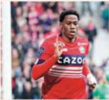
أقرب تقارير صحفية أن تشيلسي الانكليزي مهتم بالتعاقد مع المهاجم الكندي ولاعب ليل الفرنسي جوناثان هدايف من نادي ليل الفرنسي. ويحتاج الجولز بحسب ما يرى «ماركس» بوتشينو إلى تحسين مهاراته الهجومية، وأشار موقع «فوتبول لندون» للنادي الشدني قد فتح محادثات التعاقد مع جوناثان هدايف ما يتخطى حوالي 40 مليون باوند. وسجل المهاجم 11 هدفاً وسنة تمريرات حاسمة هذا الموسم مع ليل في كل المسابقات. ويمنى نادي الشدني في صيف عام 2025، وهو ما قد يدفع إدارة نادي ليل إلى بيع اللاعب قبل نهاية عطلة، قبل أن يتوجه للعب في

العام 2025، وهو ما قد يدفع إدارة نادي ليل إلى بيع اللاعب قبل نهاية عطلة، قبل أن يتوجه للعب في