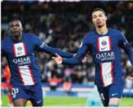
معمان كيليان مبابي نجم باريس سان جيرمان، وشقيقه الأصغر إيثان مبابي لاعب الوسط الواعد مع أحد أندية لويون إنريكي المصاب الكلى للفريق وأمو إنريكي على موقفه، وفر من قراره على الإدارة الرياضية بضرورة الاستغناء عن المهاجم الشاب

هو جو إنكيكي صاحب الـ 21 عامًا، وباتلعل النقل إنكيكي إلى صفوف أياواخت فرانكلورت الألماني، معاراً لهبة الموسم الجاري في الساعات الأخيرة السوق الانتقالات الشتوية. وكتب إنكيكي عبر حسابه الرسمي على «إنستغرام»: «لا أطلب الانتظار لمدة طويلة مع فرانكلورت، أريد رجلاً مسافراً مع فريقه من زملائه في الفريق الباريسي. ولتصديق مبابي حيلة دعم زميله الفرنسي حيث وجه له رسالة تحفيزية قوية وجمالية، وبنفس اللهجة كتب إيثان مبابي «أنت الآن منظرنا وبناقلنا» وتلقى هو جو إنكيكي رسائل تشجيع أخرى من باقي زملائه مثل عثمان ديمبلي وبرسيل كيمبي. وكان إنكيكي انضم لصفوف سان جيرمان في صيف 2022 قادماً من رينس، ولكنه خرج تعاماً من حسابات لويون إنريكي منذ بداية الموسم الجاري.