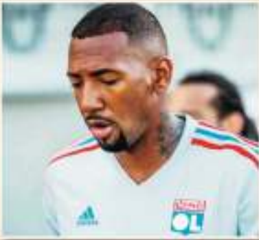
أتم الألماني جيروم بواتينغ مفاوضات توقيع السبق، انتقاله إلى الدوري الإيطالي، في صفقة انتقال حرة، خلال الساعات القليلة الماضية. وبحسب خبر الانتقالات الشهير «فوتبول» رومانو، على حسابه الرسمي بموقع التواصل الاجتماعي، فإن جيروم بواتينغ سيحجز صفوفه سالفيرينا وأندريا رومانو ديونيك موقع على عقد مع الفريق الإيطالي كلاب، حرة، لتد أكمل بالفعل الفحص الطبي، وسيبقى تحت قيادة المدرب فيليبو إنزاغي. وتوقع أن يوقع بواتينغ مع لومبارديا، ثم الهبات الصلقة بعد ذلك. وتلقى بواتينغ 18 أرقام في بارنك مولد، وفاز مع الفريق الهناري بالكثير من الألقاب، وكان من بينها البطولة التاريخية في 2011 و 2020. قبل الانتقال إلى ليدون الفرنسي.