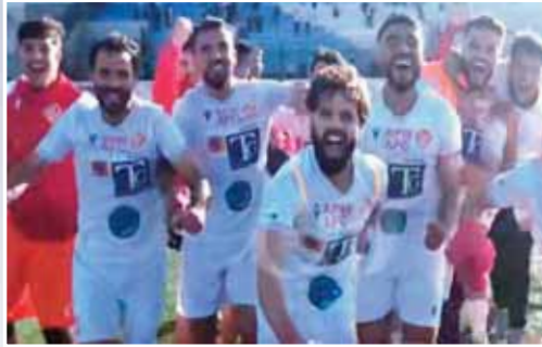
ثمين لشباب تموشنت، ثلاث نقاط وضعت الفريق في المركز الثالث برصيد 56 نقطة، ليعزز بذلك حظوظه بشكل كبير في التأهل إلى دورة اللقب ولم يعد يفصل «السيارتي» عن تحقيق هذا الهدف سوى مباراة واحدة حاسمة أمام وداد تلمسان.

فترات الشوط. مع انطلاق الشوط الثاني، دخل شباب عين تموشنت بوجه مغاير تماما، حيث أظهر لاعبه عزيمته أكبر ورغبة واضحة في الوصول إلى شبك المنافس، الضغط العالي وتحسن الانتشار فوق أرضية الميدان ساهما في خلق بعض الفرص، إلى أن جاءت الدقيقة 69 التي حملت