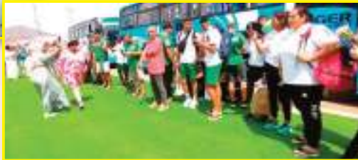
مدن جزائرية في الفترة ما بين 5 و15 جويلية المقبل، حسبما

الرهان كبير على رياضي المنتخب الوطني خصد أكبر عدد من الميداليات خلال فعاليات ألعاب القوى، التي تنطلق يوم 4 جويلية، "في ظل اللياقة الجيدة التي أبانوا عليها خلال المنافسات الدولية"، معولا على وجه الخصوص على اختصاصي سباقات السرعة. كما أكد نفس المسؤول جاهزية الملعب الأولمبي ميلود هفني لاحتضان مسابقات ألعاب القوى، بعد المنافسة التجريبية التي استضافها نهاية الأسبوع الفارط من خلال تنظيم ملتقى وطني لأم الرياضات. وينطبق الأمر نفسه على الملعب الملحق الذي سيكون متناحا لتدريبات الرياضيين المشاركين في الألعاب العربية. يضيف نفس المسؤول. يذكر أن وهران تستضيف، إلى جانب ألعاب القوى، منافسات رياضات كرة اليد (ذكور) والجمباز والسباحة والكرة الحديدية، علما وأن المدن الأخرى المعنية بالألعاب العربية هي الجزائر العاصمة وقسنطينة وتيبازة وعنابة.