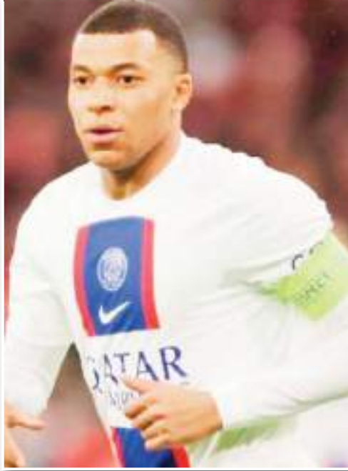
ظهر النجم الفرنسي كيليان مبابي في إعلان جيرمان للموسم المقبل، وهو يرتدي القميص أبيض قميص فريق باريس سان الأبيض "الثاني" للفريق الفرنسي العاصمة.

وحسب التحديثات الأخيرة فإن ريال مدريد لا يزال ينتظر حدوث بضعة أشياء تُسهّل وصول مبابي، وهي أن يتخلى اللاعب عن المكافآت المالية التي وعده بها باريس سان جيرمان. إذا فعل مبابي ذلك فقد تكون هناك فرصة حقيقية لريال مدريد لرؤية اللاعب بالقميص الأبيض على ملعب سانتياجو برنابيو للدفاع عن ألوان اللوس بالانكوس. لكن لا يبدو بأن هذا هو الحال في الوقت الحالي، تريد إدارة باريس بيعه ولكن بشرط أن يتخلى عن المكافآت وذلك لكي لا يخسرون اللاعب مجاناً في صيف عام 2024، أما اللاعب فتفكيره في الوقت الحالي البقاء في باريس لمدة عام آخر لجني 150 مليون يورو أخرى.