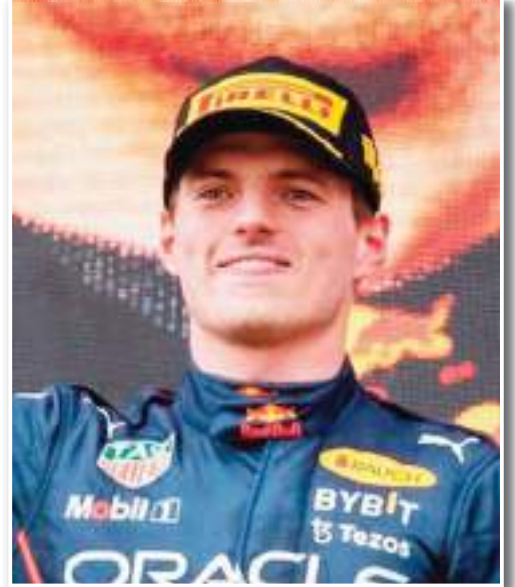
طالب الهولندي ماكس فيرستابن سائق فريق فورمولا-1، ببذل المزيد من الجهود لحماية ريد بول المنافس في سباقات سيارات السائقين في رياضة المحركات. وجاءت تلك

المطالبات، بعد مصرع السائق الشاب الهولندي ديلايو فان هوف، يوم السبت، متأثراً بإصابات تعرض لها في حادث على مضمار سبا-فرانكورشان البلجيكي. ولقي فان هوف مصرعه عن عمر 18 عاماً، إثر حادث تصادم مروّع خلال أحد سباقات بطولة فورمولا الإقليمية الأوروبية، على مضمار سبا-فرانكورشان الذي سيحتضن آخر سباقات فورمولا-1، قبل الإجازة الصيفية في وقت لاحق من جويلية الجاري. ووقع التصادم بين عدة سيارات على أرضية المضمار المبللة بمياه الأمطار، حسبما ذكرت وكالة الأنباء البريطانية "بي بي سي ميديا".