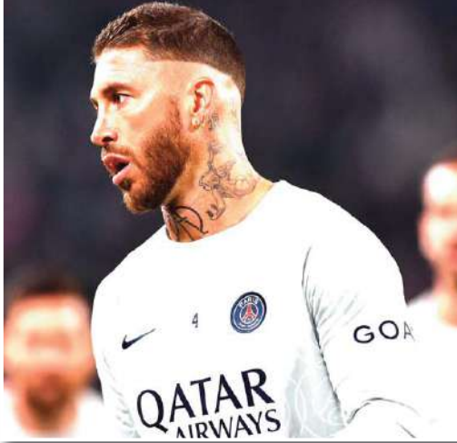
ميونخ في ثمن نهائي دوري الأبطال، عامل إشارات إيجابية حول قدرته على اللعب في حاسم لمستقبل راموس، إذا قدم الأخير أعلى مستوى.

حصل نادي النصر السعودي، على دفعة قوية بشأن إمكانية التعاقد مع سيرجيو راموس مدافع باريس سان جيرمان. وينتهي عقد راموس مع باريس في صيف 2023، ويخطط النصر لإغراء المدافع الإسباني براتب كبير للانتقال إلى الدوري السعودي عبر صفقة مجانية. ووفقاً لصحيفة "أس"، فإن العديد من الشكوك ظهرت مؤخراً لدى إدارة سان جيرمان، بشأن تجديد عقد راموس.