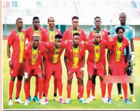
الشروع في لعب المواجهات الرسمية في الشان.

من خلال دراسة أداء منافسينا حيث أن محلل الأداء الخاص بنا يعكف على دراسة نقاط قوة و ضعف منافسينا في الشان من خلال تحليل آخر مباراتين للنيجر وكذا الكاميرون، هو متواجد حاليا في بروكسل وستنضم إلينا في تونس خلال التريبن من أجل وضع آخر اللمسات خاصة على مستوى الشق الهجومي."