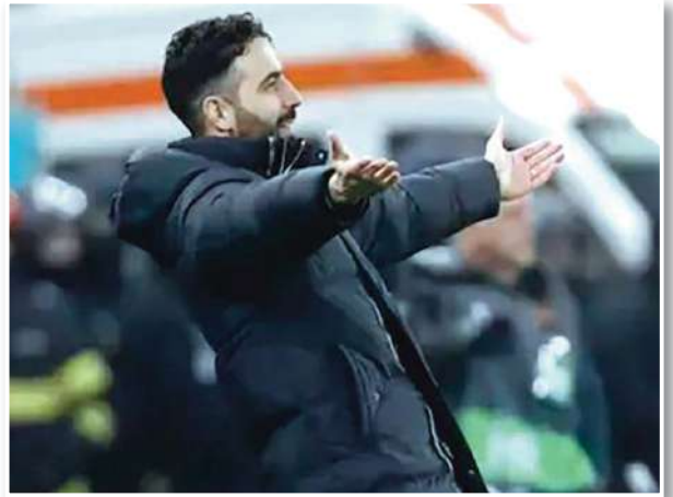
علق البرتغالي روين أموريم، المدير الفني لمانشستر يونايتد، على خسارة فريقه أمام فولهام يوم الأحد، وتوديع كأس إنجلترا من دور الـ16. وسقط مانشستر يونايتد أمام ضيفه فولهام، بركلات الترجيح، بعد التعادل في الوقت الأصلي والإضافي 1-1. وقال أموريم، في تصريحات لهيئة الإذاعة البريطانية (بي بي سي) عقب المباراة: «تكننا

من التسجيل في الشوط الثاني بعد الهدف الذي استقبلناه قرب نهاية الشوط الأول». وأضاف: «من الصعب علينا أن نضغط بقوة لكننا نجتاح في ذلك وأحرزنا هدفاً، أعتقد أنه كان لدينا فرص أفضل، في النهاية، يمكن أن تذهب ركلات الجزاء في كلا الاتجاهين ولم تكن في صالحنا». وتابع: «من المهم أن نقول إنه مع التبدلات كانت لدينا فرصة للفوز بالمباراة». وأكد: «أعتقد أننا أفضل في الكرة الأولى من الثانية، وأعتقد أيضاً أن الأمر يتعلق بوجود اللاعبين، برونو وكاسيميرو وجوش زيوكري يتحسنون كثيراً». وعن ركلات الترجيح، قال: «أحاول إرخاء اللاعبين، وهم يعرفون أن الأمر يتعلق بالخائب الفني، لكن عليك أن تكون مسترخياً وواثقاً». وواصل: «الهدف هو الفوز بالدوري الإنجليزي الممتاز، أعلم أننا نخسر مباريات، لكن الهدف هو الفوز بالدوري الإنجليزي الممتاز مرة أخرى». وأوضح: «لا أعرف كم من الوقت سيستغرق الأمر، لدينا هدف وسنواصل التقدم مهما حدث.. من المستحيل معرفة ذلك لكنك تبدأ في فهم أن اللاعبين أصبحوا أفضل ونحن نفهم الدوري.. سترى في المستقبل». وختم: «إنه أمر مهم حقاً لكن يبعين علينا استعادة اللاعبين، كانوا متعبين حقاً، ولدينا ثلاثة أيام ثم سنلعب هنا في أولد ترافورد ضد آرسنال».