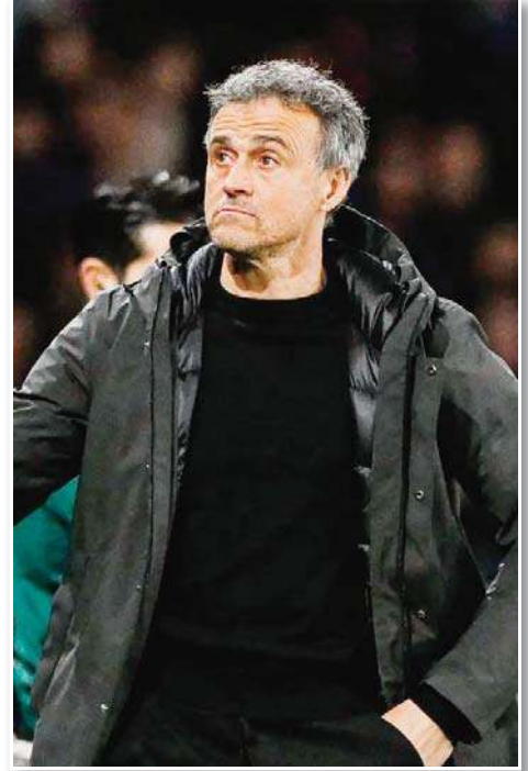
يقف لويس إنريكي مدرب باريس سان جيرمان، في قدرات فريقه، قبل مواجهة ليفربول، الأربعاء، في ذهاب دور ال16 لدوري أبطال أوروبا. وقال

إنريكي في تصريحات أبرزتها صحيفة لوباريزيان "الفوز على ليل 4-1 كان اختباراً مثالياً ومفيداً لنا قبل مواجهة ليفربول، لأن هناك عدداً من أوجه التشابه بين الفريقين، وأعتقد أن أداءنا في الشوط الأول هو أفضل مستوى لنا هذا الموسم". وأضاف المدرب الإسباني "ليفربول أقوى فريق في أوروبا على مستوى الأداء والنتائج، لقد حسموا تأهلهم مبكراً، لكننا لا نخاف، وأرى أن فرصنا أمامهم 50٪". وتابع "الأرقام باريس سان جيرمان من أفضل الفرق في أوروبا على مستوى الاستحواذ وصناعة الفرص والتهديف واستخلاص الكرة من المنافسين". وواصل "لا أتفق مع ما يقال إن باريس سان جيرمان خرج في المواسم السابقة من دوري الأبطال بسبب عامل الخوف، لا مجال للخوف في كرة القدم بل من الوارد أن يؤدي الفريق بشكل جيد أو بمستوى أقل". وأشار "نمر" بأفضل فترتنا هذا الموسم، وتنتظرنا مباراة صعبة للغاية، ولكن ما يسعدني أنه لدي حالياً 18 لاعباً جاهزاً بإمكانهم المشاركة يوم الأربعاء المقبل أمام ليفربول، في مواجهة مثالية نهائي مبكر". وشدد لويس إنريكي في ختام تصريحاته "دوري أبطال أوروبا مسابقة عامرة بالتحديات والصعوبات ومن يغفل أو ينام سينجرف مع التيار".