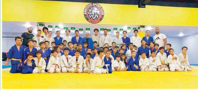
بشكل أفضل للمنافسات.

يواصل النادي استعداداته لعدة بطولات هامة، حيث يشارك أحد رياضيه في بطولة إفريقيا، وهو ما يعكس المستوى العالي للمصارعين الذين يطمحون إلى تحقيق إنجازات دولية. كما يستعد الفريق لخوض البطولة الوطنية لفنّي الأواسط والأشبال بعد رمضان، في ظل برنامج تدريبي متوازن يأخذ بعين الاعتبار طبيعة الشهر الفضيل. خلال رمضان، يتم تعديل الحصص التدريبية، حيث يتم تقليل كثافتها قبل الإفطار مع التركيز الأكبر على اللياقة المصارعين وضمان الترويح، للحفاظ على لياقة المصارعين وضمان استعدادهم للمنافسات القادمة. لا يقتصر هدف النادي على تحقيق البطولات فقط، بل يسعى أيضا إلى تربية أجيال جديدة وإعادة الشباب عن الانحراف من خلال الرياضة. كما يطمح النادي إلى الوصول إلى منصات التتويج العالية والأولى، وهو ما يتطلب دعما أكبر من الجهات المسؤولة.