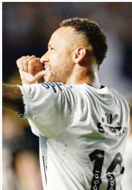
المباشرة في مسيرته، بواقع 5 مع برشلونة، و7 وريقة باريس، و3 بقميص سانتوس.