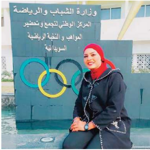
بطولة كرة السلة للقسم الممتاز؟

«مستوى البطولة اقليمية لكرة السلة لا بأس به وهي في تحسن ملحوظ».