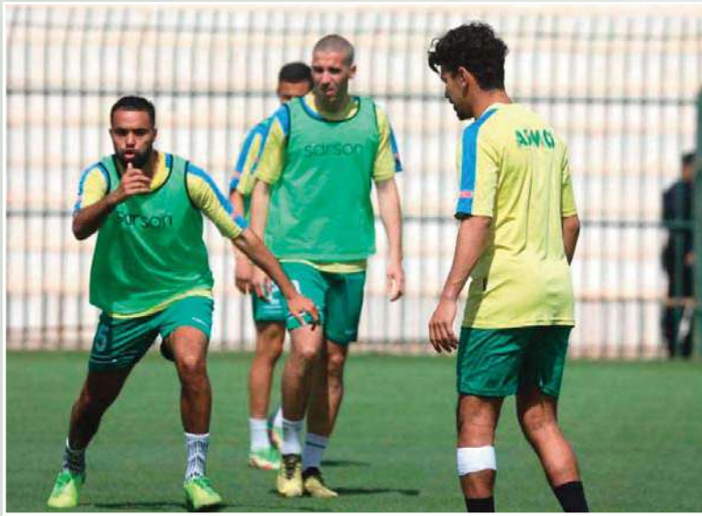
لا يجب تعليق الشماعة على الصيام

أكدت إدارة لازمو بأن الفريق بشكل عام كان خارج الإطار في مباراة وداد تلمسان، وهي حقيقة لا يجب على الإطلاق إغفالها أو الهروب منها، فباستثناء 5 لاعبين على الأكثر أدوا ما عليهم فإن البقية كانوا تائهين تماما، ووصل الأمر ببعض منهم إلى عدم القدرة حتى على الركض، فكان من الطبيعي أن يستغل الضيوف فرصة وجود أصحاب الأرض في هذه الحالة المتدنية من أجل انتصاف انتصار كان يبدو في غاية الصعوبة والتعقد بالنسبة للزيانيين.