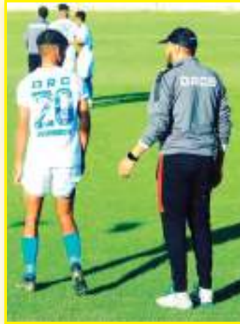
يشغل منصب التحكيم حاليا

«بصراحة هنا في هذه الفئات الشبانية يجب أن نعرف متى نبرمج لهم المباريات لان الصغار لا يعرفون مثل الكبار كيفية تقسيم الجهد فغالبيهم يلعب حتى يتعب لذا هنا فقد تكون خطورة على الصغار أن يلعبوا القدم في شهر رمضان ومن الجميل برمجة كل مباريات الفئات الشبانية بعد الفطور وهو إلى ما بعد العيد والاكتفاء بالتدريبات الفنية والغير شاقعة.»