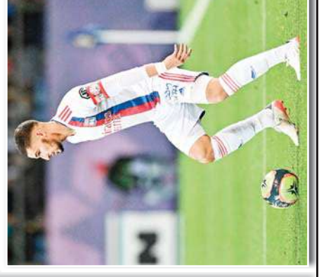
أعلن نجم الجزائر حسان عوار أن تابولي قد دخل السباق لضمه في فريقه الجديد.

أعلن نجم الجزائر حسان عوار أن تابولي قد دخل السباق لضمه في فريقه الجديد. وقال عوار إن تابولي لاعب ذو خبرة وكفاءة عالية، وهو خيار جيد للفريق.