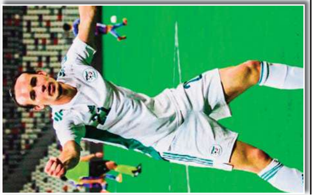
بوعدنانني يثني على بوعدنانني، مدربه السابق في نيس، على ما قاله في مقابلة مع صحيفة "ل'إكو" الفرنسية.

بوعدنانني، الذي لعب في نيس من 2006 إلى 2016، كان لاعباً متعدد المواهب، قادراً على اللعب في مركز المهاجم، الجناح، والوسط. ذكره المدرب البحراني كأحد أفضل اللاعبين الذين لعبوا معه في نيس، حيث كان له دور كبير في نجاح الفريق في الدوري الفرنسي.