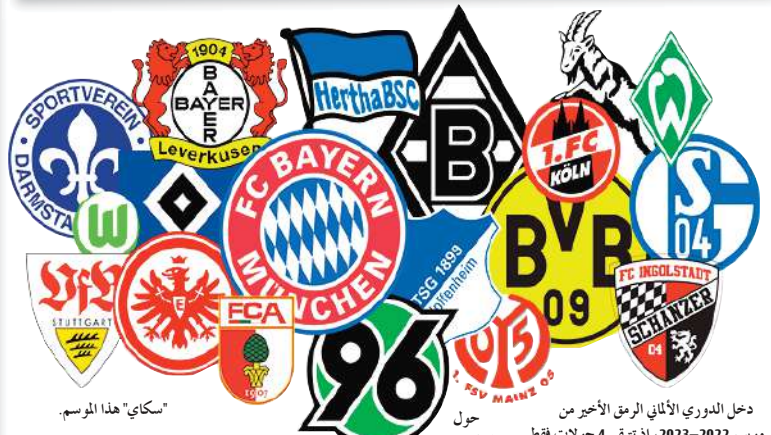
"سكاى" هذا الموسم.