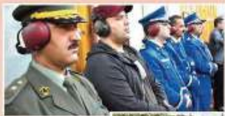
حسب الفرق ذكور وإناث.

احصت المديرية العامة للأمن الوطني بالتنسيق مع أمن ولاية معسكر والمصلحة الجهوية للصحة والشباب الاجتماعي والأنشطة الرياضية البطولة الوطنية للرمية بالمسدس في طبعها الـ 35 ما بين مصالح الشرطة التابعين للتواصي السنة لبروح الوطن كما عرفت هذه البطولة بمشاركة قيادة الدرك الوطني بقيادة رياضيين، التي تخرج من خلال الاحتفالية للرمية إليها وبين