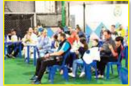
تواصل نشاطات مدرسة النادي الهواي الرياضي وهران، من خلال إحصاء

شهد الحفل الذي نظمته إدارة النادي الرياضي الهواي وهران حضور معتبر لأولياء اللاعبين، في مقر النادي الواقع بحي العثمانية. وذلك لمرافقة أولادهم في هذا الحفل التكريمي. كما حرص مدربي الفئات الشبانية على حضور الأولياء أو أحد الممثلين في حالة غياب، وذلك تقديرا للعمل القاعدي لوضع اللاعبين في أحسن الظروف معنويا، وتشجيعهم على مواصلة المسار الدراسي. وفي سياق آخر حضر بعض اللاعبين السابقين