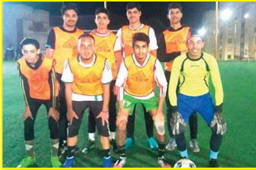
رياضيين ومتففين وبإمكانه تنظيم تظاهرات رياضية وثقافية مختلفة. وهذا ما يتجلى خلال هذه الدورة التي تعرف تليلات.

يبقى الهدف الأول من تنظيم هذه الدورة الكروية حسب المنظمين هو إعطاء أحسن صورة عن الحي الجديد لاصيرا. وبأنه في هذا الحي يوجد