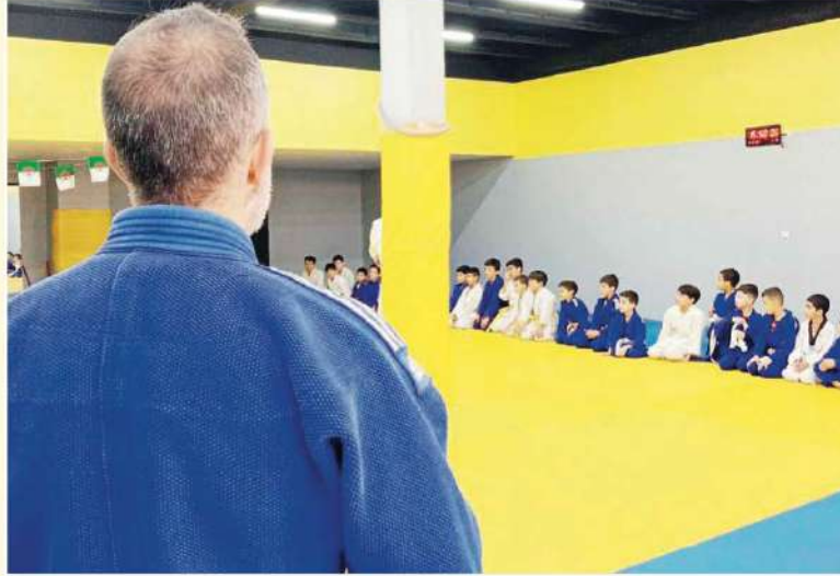
الصفحة لتكون منصة تجمع كل محبي الجودو، سواء كانوا مدربين، لاعبين، أو

نعمل عليه هو تأسيس قناة رياضية خاصة بصفحة «عشاق رياضة الجودو»، والتي ستخصص في تغطية جميع البطولات الوطنية والدولية. نريد أن يكون للجودو منصة إعلامية تسلط الضوء على هذه الرياضة، وتنقل إنجازات اللاعبين الجزائريين للعالم.»