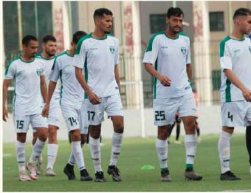
المواجهة صعبة لكن الفوز ليس مستحيلا

ولا يمكن الإنكار على الإطلاق بأن اللقاء سيكون صعبا ومعقدا على جمعية وهران أمام خصم يطمح للصدور والابتعاد أكثر في صدارة الترتيب أمام ملاحقه المباخر رائد القبة، ولهذا لن يكون من السهل الإطاحة بالنجم، لكن في نفس الوقت لا يجب احترام الخصم أكثر من اللازم، وجمعية وهران بدورها قادرة على تجاوز هذه العقبة بنجاح، وسبق لها وأن برهنت على ذلك في عدة مناسبات، وآخرها الانتصار على الرصيف رائد القبة بهدف دون رد بملعب بوعلقل، وهو السيناريو الذي يمكن تكراره إذا ما آمن اللاعبون بقدراتهم وإمكاناتهم. وعلى الرغم من التباين من ناحية الأهداف والطموحات، إلا أن أبناء المدينة الجديدة عليهم التحلي بالإرادة والحزيمة، وكذا التركيز التام والهدوء بعيدا عن الضغوطات الخارجية، وذلك من أجل تحقيق الأهم وهو الانتصار، فحصد النقاط الثلاثة سيكون له العديد من الجوانب الإيجابية، لأنه سيرقرب النادي كثيرا من الوصول إلى بر الأمان وتحقيق البقاء.