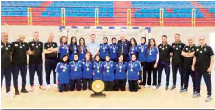
حين تصيح الأكاديمية هي الضمان الحقيقي للأجيال القادمة