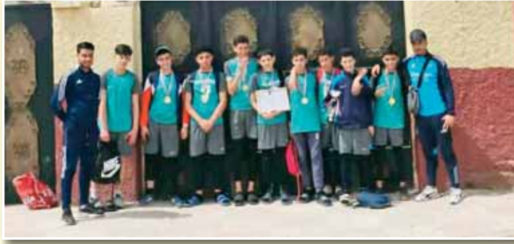
إشادة واسعة وتكريم لكل المساهمين في النجاح

فقط، بل كانت فرصة لتشيين جهود جميع الفاعلين في إنجازها. حيث تقدمت الرابطة الولائية للرياضة المدرسية لولاية معسكر بجزيل الشكر والامتنان لكل من ساهم في التنظيم المحكم، وفي مقدمتهم أساتذة التربية البدنية، الذين كانوا العمود الفقري لهذا النجاح كما تم التنبؤ به بالمجهودات الكبيرة التي بذلها الحكام لضمان السير الحسن للمباريات، إضافة إلى عمال قاعة بمرمة ميلود بغريس على حسن الاستقبال والتنظيم، ورجال الحماية المدنية الذين أمنوا الغطية الصحية والوقائية للحدث. ولم يُغفل المنظمون الدور الكبير الذي لعبه أولياء التلاميذ، من خلال مرافقتهم الدائمة وتشجيعهم المستمر لأبنائهم، ما ساهم في خلق أجواء عائلية مميزة. بهذا التتويج، تؤكد متوسطة الإخوة مداح مكانتها كأحد أبرز الأقطاب في الكرة الطائرة المدرسية بولاية معسكر، في انتظار مواصلة التألق في المراحل القادمة، وسط آمال كبيرة بمواصلة المشوار بنفس القوة والطموح.