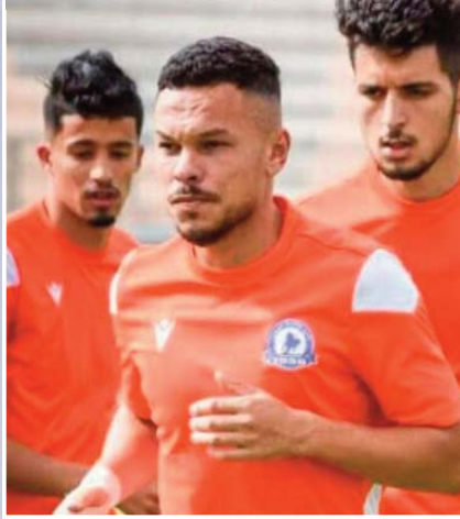
والفنية بالإضافة للحلحة المعنوية التي لا بد أن تكون عالية خاصة وأن المباراة ذات أهمية كبيرة بالنسبة للفرسان.