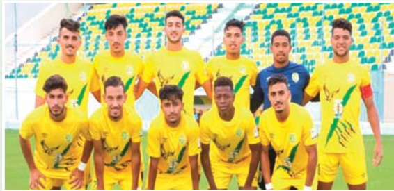
يواجه رديف شبيبة الساورة، قائد الرابطة المحترفة الأولى لفئة الرديف، نظره من شباب قسنطينة اليوم، على أرضية ميدان هذا الأخير، حساب الجولة الرابعة من الرابطة المحترفة الأولى لفئة