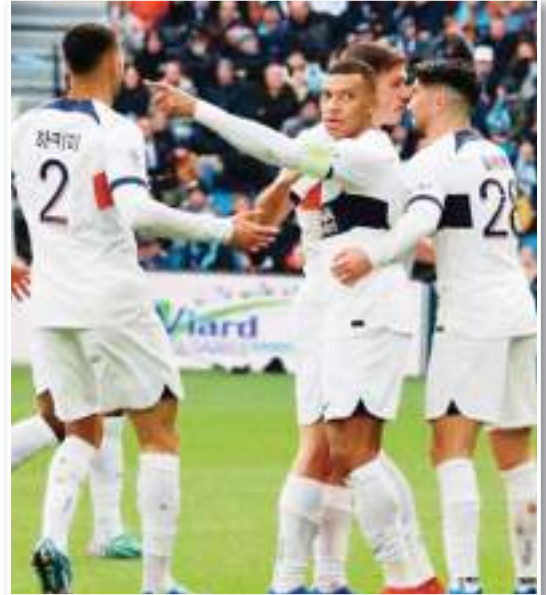
عاد فريق باريس سان جيرمان بفوز ثمين من ميدان مصيفه، لوهافر، في اللقاء الذي جمع بينهما مساء يوم الأحد، في الجولة الرابعة عشر من الدوري الفرنسي، بالانتصار بهدفين دون رد. النادي الباريسي تغلب على الظروف التي

ومع انتهاء الشوط الأول على وقع هدف مباي، حاول الفريق الباريسي مضاعفة النتيجة وتأمين الانتصار، خاصة في ظل النقص العددي، وسط محاولات من لوهافر لاستغلال تفوقه عددياً لإدراك التعادل، لكن الأمور ظلت على حالها حتى الرق الأخير من اللقاء. وقبل نهاية الوقت الأصلي للمباراة بدقيقة واحدة، وضع فيثينا رصاصا الرحمة في قلب الفريق المحلي، بعدما سجل الهدف الثاني لكنتية المدرب الإسباني لويس إنريكي. وفي ضوء النتيجة، يحكم الفريق الباريسي قبضته على صدارة جدول الترتيب، بعدما رفع نقاطه للرقم 33، بفارق أربع نقاط كاملة عن نيس الموصيف، في حين توقف رصيد لوهافر عند 16 نقطة يحتل بهم المرتبة التاسعة في الجدول.