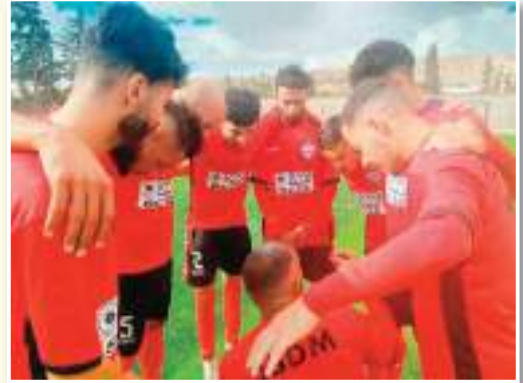
نجح شباب جنين مسكين من تحقيق فوز مهم في بطولة القسم الجهوي الأول لرابطة سعيدة عندما

قام مدرب فريق شباب جنين مسكين تقيه قادة بتحضير لاعبيه كثيرا طيلة الأسبوع أثناء التدريبات وحتى قبل اللقاء بلحظات مطالبا أشباله بضرورة الفوز ومواصلة التألق والتقدم في سلم الترتيب.