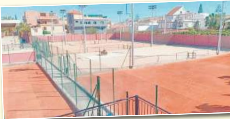
يستمر حاليًا بعين المكان.

منظم في وهران عدة ترجمات في مختلف الرياضات، على غرار العسكرو الذي جرى قبل