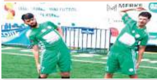
ما هي طموحاتك؟

"الحمد لله، لقد بذلت قصارى جهدي لتشريف الفقة التي تم وضعها في شخصي، خاصة وأنتي حملت شارة القائد وهي مسؤولية كبيرة بالنسبة لي. ولهذا فريقي من أفضل سبحانه وتعالي. كما