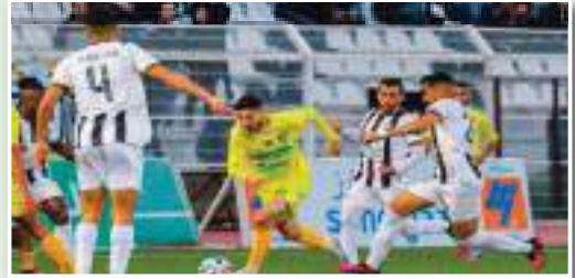
سعود عجلة الرابطة المحترفة الأولى إلى الدوران و ذلك من خلال إقامة مباريات الجولة 25 التي ستجرى جميعا هذه المرة

سكون الأنظار مصوبة نحو ملعب أول نوفمبر بتيزي وزو الذي يحتضن قمة الجولة 25 من الرابطة المحترفة الأولى، حين يستقبل القبائل ضيفه مولودية الجزائر في مباراة بأهداف متباينة بما أن تشكيلة المدرب بوزيدي تبحث عن الانتصار لمواصلة الابتعاد عن المنطقه الحمراء، فيما تطمح كتيبة الفرنسي باتريس بوميل إلى تعزيز مركزها في البوديوم. في مباراة أخرى يطمح وفاق سطيف إلى تجاوز تعثراته الأخيرة حين يحل ضيفا على هلال شلغوم الذي سقط منذ عدة جولات من خلال العودة بالقاط الثلاث التي تعيد حظوظه في المنافسة على تحقيق مرتبة قارية الموسم القادم.