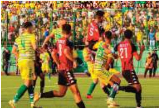
بالقاط الثلاث التي تبقيه وحيدا في الوصافة.