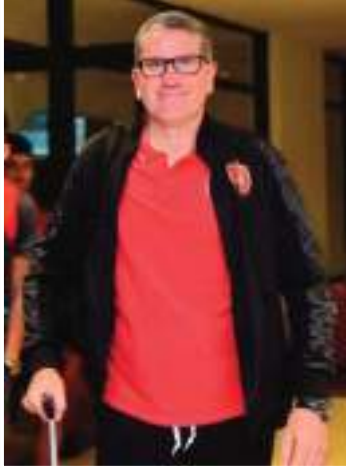
"سيرنا اللقاء بذكاء وكنا أفضل في الشوط الثاني"